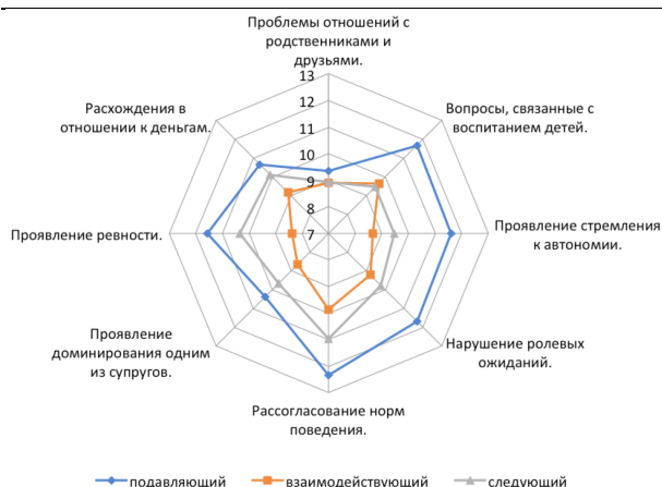
Рис. 2. Параметры конфликтности в семье в зависимости от типов детско-родительских отношений

3-й - следующий . Система взаимоотношений между родителями и детьми такого типа характеризуется стремлением проявить максимальную заботу и отражает высокую зависимость от детей. В данном случае позиция родителей отражает желание сохранять максимально хорошие отношения с детьми и производить позитивное впечатление на окружающих. Постоянная уступчивость и чрезмерное потакание потребностям детей значительно затрудняют развитие их индивидуальности и в конечном итоге приводит к деструктивным проявлениям в поведении.